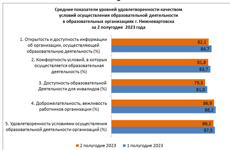
Рисунок 5. Динамика изменения средних показателей по уровням удовлетворенности качеством условий осуществления образовательной деятельности в образовательных организациях города Нижневартовска