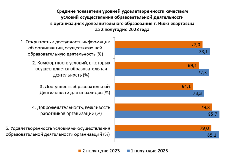
Рисунок 3. Средние показатели уровней удовлетворенности качеством условий осуществления образовательной деятельности в организациях дополнительного образования г. Нижневартовска

На рисунке 4 представлена динамика изменения количества респондентов. Во 2 полугодии 2023 года количество респондентов увеличилось на 3883 человека (14%).