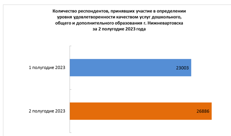
Рисунок 4. Количество респондентов, принявших участие в определении уровня удовлетворенности качеством услуг

На рисунке 4 представлена динамика изменения количества респондентов. Во 2 полугодии 2023 года количество респондентов увеличилось на 3883 человека (14%).