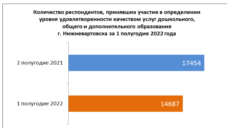
Рисунок 4. Количество респондентов, принявших участие в определении уровня удовлетворенности качеством услуг

На рисунке 4 представлена динамика изменения количества респондентов. В 1 полугодии 2022 года количество респондентов уменьшилось на 2767 (15,9%) человек.