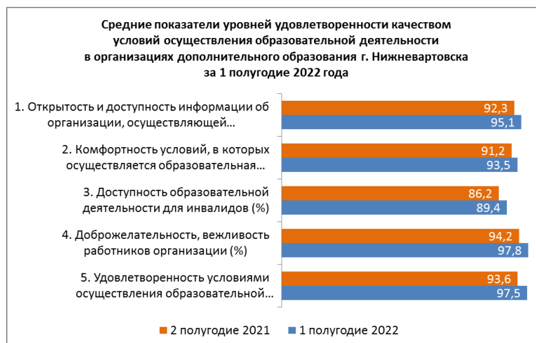
Рисунок 3. Средние показатели уровней удовлетворенности качеством условий осуществления образовательной деятельности в организациях дополнительного образования г. Нижневартовска

На рисунке 4 представлена динамика изменения количества респондентов. В 1 полугодии 2022 года количество респондентов уменьшилось на 2767 (15,9%) человек.