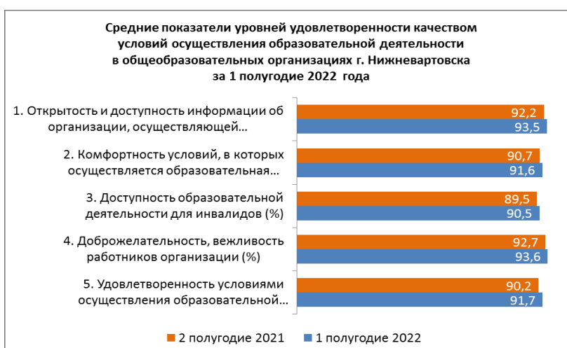
Рисунок 2. Средние показатели уровней удовлетворенности качеством условий осуществления образовательной деятельности в общеобразовательных организациях г. Нижневартовска