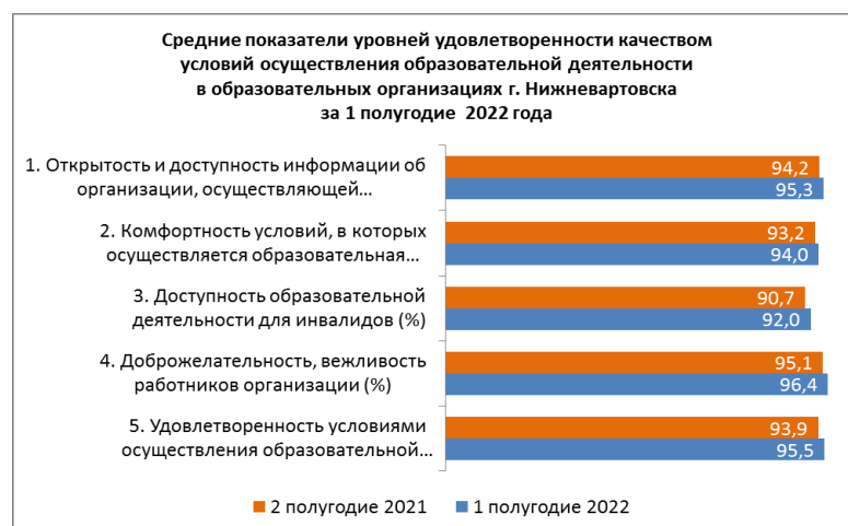
Рисунок 5. Динамика изменения средних показателей по уровням удовлетворенности качеством условий осуществления образовательной деятельности в образовательных организациях города Нижневартовска

На рисунке 5 представлена динамика изменения средних показателей по уровням удовлетворенности качеством условий осуществления образовательной деятельности за 1 полугодие 2022 года в образовательных организациях города Нижневартовска.